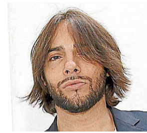
Joaquín Cortés Coreógrafo

El cantaor, hermano del genio guitarrista Paco de Lucía, ya fallecido, recoge el premio póstumo Medalla de Oro, en honor a su hermano, del Festival de cante flamenco de Lo Ferro, que es ya un referente.