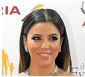
Eva Longoria Actriz

La actriz será la estrella invitada en la alfombra roja de Vogue , en el Vogue Multiplaza que se estrena en Panamá, con la Luxury Avenue , o avenida del lujo, que es el primer evento y más importante del país.