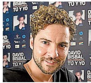
David Bisbal Cantante

La actriz será la estrella invitada en la alfombra roja de Vogue , en el Vogue Multiplaza que se estrena en Panamá, con la Luxury Avenue , o avenida del lujo, que es el primer evento y más importante del país.